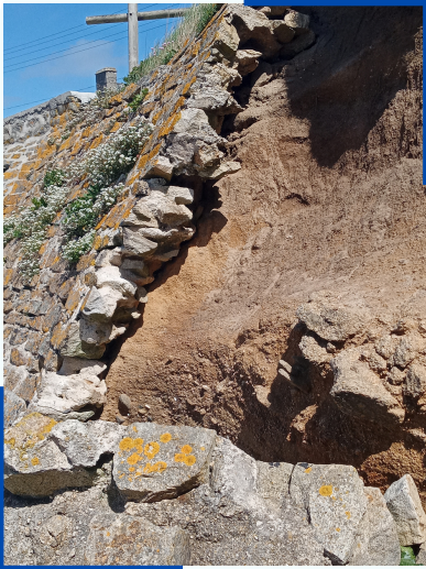
Erosion de la falaise et du mur de soutènement entre Porspoder et Lanildut