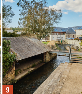
4. Saint-Aubin-du-Cormier / 5. Pont-Croix / 6. Montfort-sur-Meu