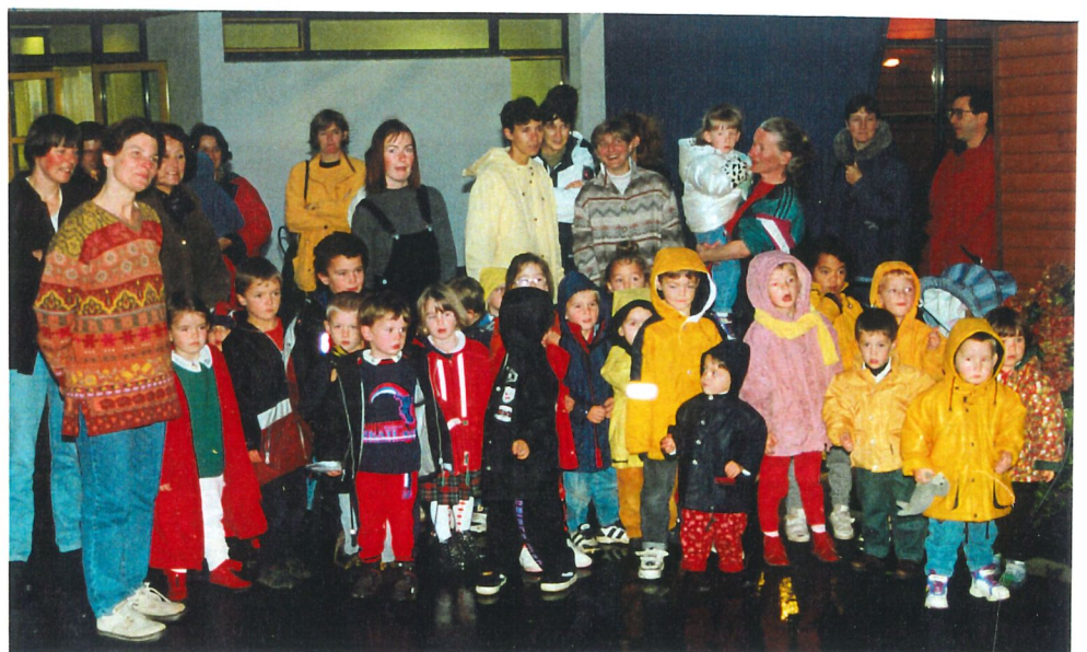
Les enfants, les enseignantes, les parents d'élèves, le personnel lors de l'inauguration.

Le bilan financier s'établit de la manière suivante. Les travaux s'élèvent au montant de 3.337.253 F, les subventions à : 866 480 F, les prêts CAF Pêche et CAF Nord-Finistère à : 319 000 F, les emprunts à : 1 600 000 F, et le prêt relais TVA à : 530 000 F.