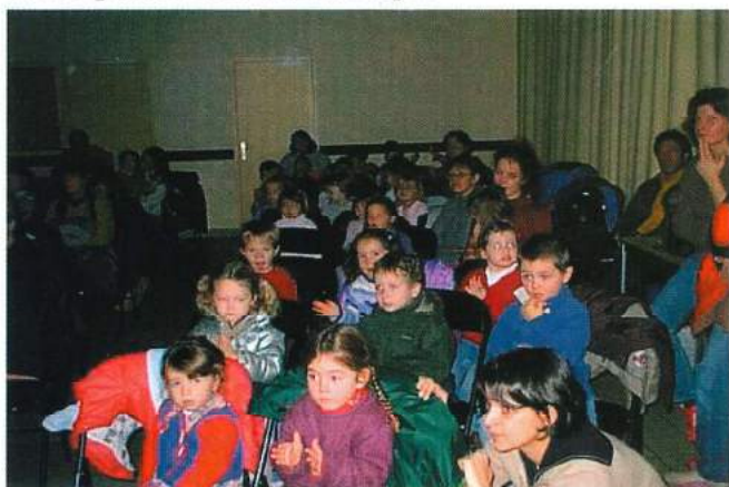
Le CMJ Un nouveau Conseil Jeunes fin janvier

Ainsi, à la rentrée l'effectif s'élève à 453 élèves dont 175 pour le collège, 165 pour l'école Jean Monnet et 113 pour l'école Saint Joseph.