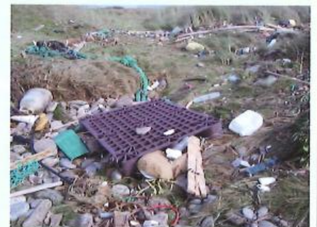
La plage des Blancs-Sablons après une tempête...