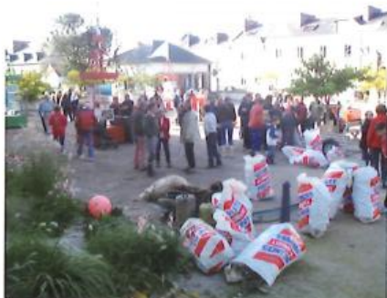
Le Défi Conquétois : les équipes réunies devant le parvis de la mairie.

C'est un challenge qui consiste à ramasser un maximum de déchets en prenant bien soin de les trier par famille (plastique, polystyrène, verre, ferraille, etc.). Par l'intermédiaire du tissu associatif conquétois, des équipes se forment et se partagent les zones de ramassage. Au terme du temps donné, l'équipe « gagnante » est désignée par un jury, composé par les membres d'AR VILTANSOU.