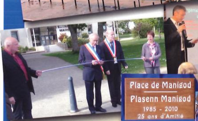
Place de Manigod Plasenn Manigod 1985 - 2010 25 ans d'Amitié