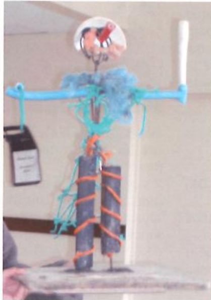
Le Trophée AR VILTANSOU ou Monsieur « Beurk ».

(dénommé Monsieur « Beurk » par les enfants !) est ainsi confié à l'équipe victorieuse et remis en jeu l'année suivante !