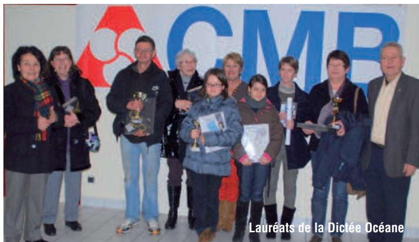
Lauréats de la Dictée Océane