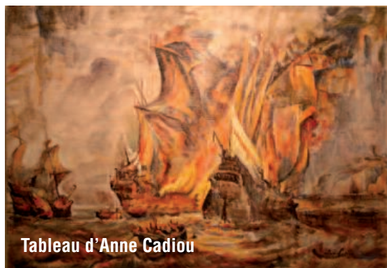
Tableau d'Anne Cadiou

http://www.la-mer-en-livres.fr/nouvelles.html