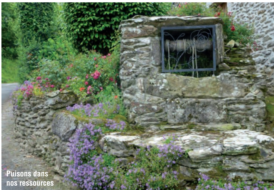
Puïsons dans nos ressources

Le nombre de ménages ayant 2 voitures a augmenté entre 1999 et 2008 de 54 %.