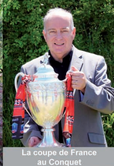
La coupe de France au Conquet