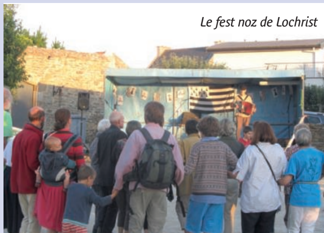
Le fest noz de Lochrist

A partir de 19h00. Concerts et animations gratuits. Restauration rapide et buvette sur place gérées par les bénévoles du club Top Forme, du Comité de jumelage et du Tennis Club du Conquet.