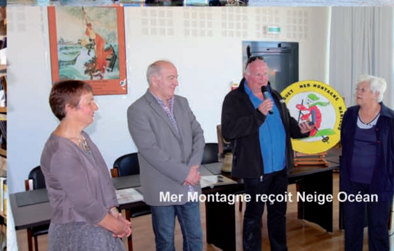
Mer Montagne reçoit Neige Océan