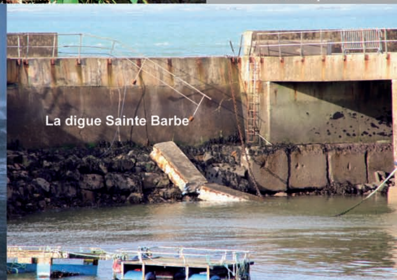
La digue Sainte Barbe