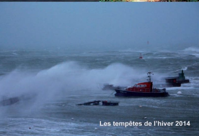
Les tempêtes de l'hiver 2014