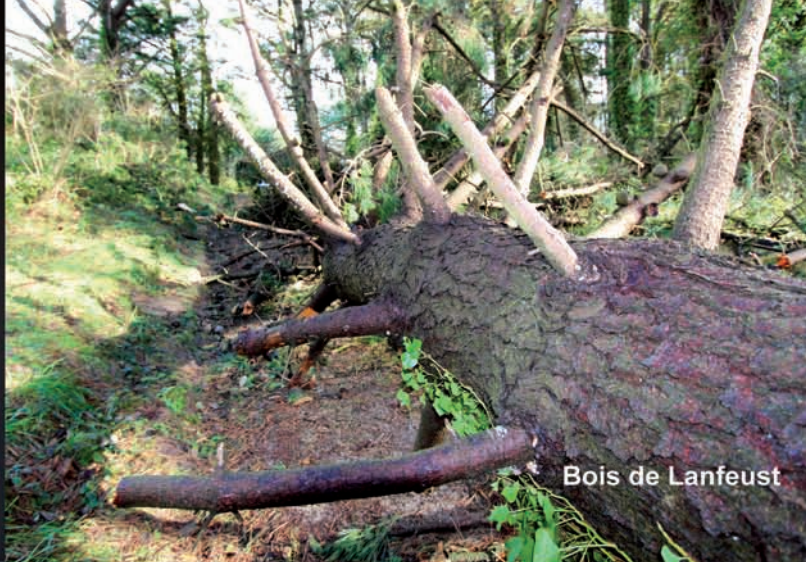
Bois de Lanfeust