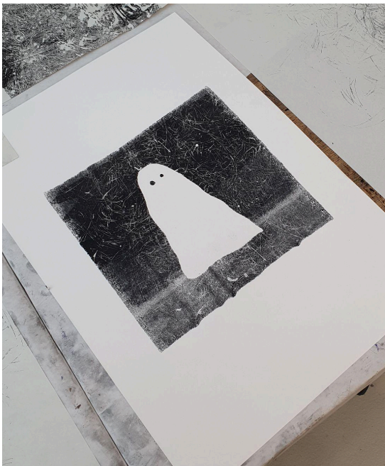
Illustration Filet Fantôme , Gravure à partir de filets de pêches du Conquet, Léo Barbotin