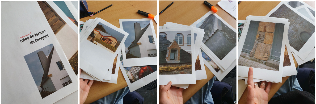
Atlas de formes du Conquet, photographies numériques, Léo Barbotin