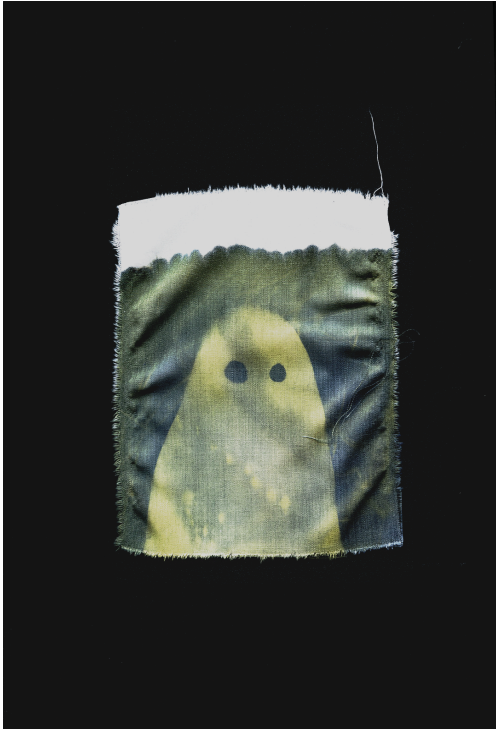
Illustration Filet Fantôme , Cyanotype non rincé sur textile naturel, texture à partir de filets de pêches du Conquet, Léo Barbotin